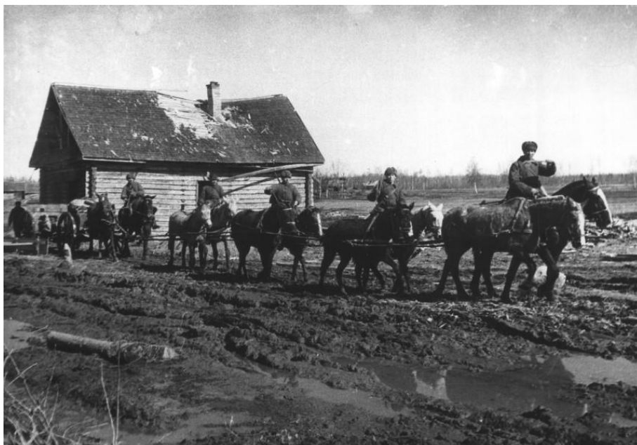
КОМК 37882/79 311-я стрелковая дивизия. Пять парных упряжек тянут пушку по весеннему бездорожью. Апрель 1942 г.

В каждом стрелковом полку по штату полагалось иметь триста пятьдесят лошадей. Конечно, были они и в полку, где служил сержант Стрелков.