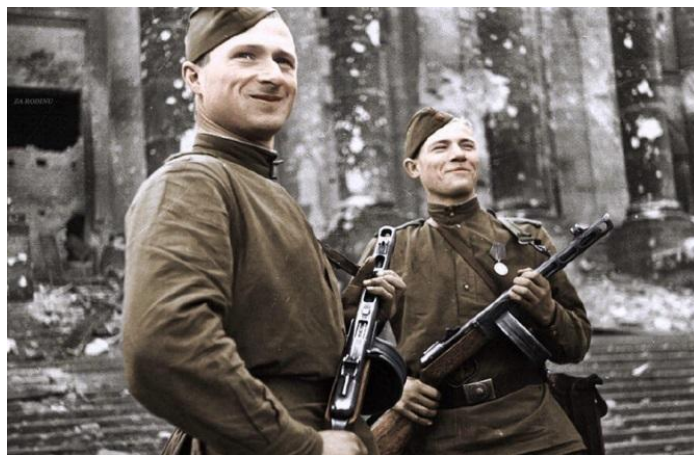
Май 1945 г. Бойцы Красной Армии на фоне Рейхстага. Фото из открытых источников. На красноармейце справа – трофейный немецкий ремень