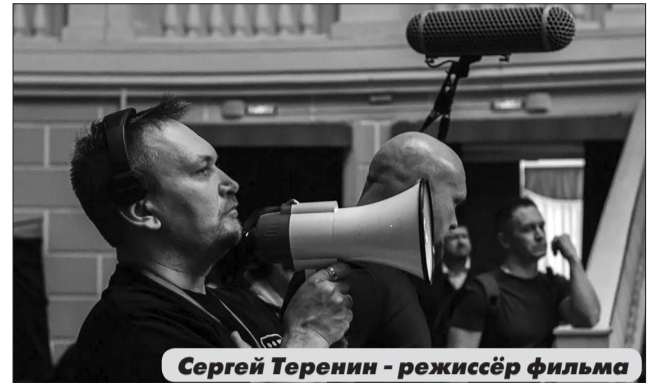
Сергей Теренин - режиссёр фильма

В марте пройдёт несколько премьерных показов в Кирове, в Вятских Полянах, в апреле - в Омутнинске.