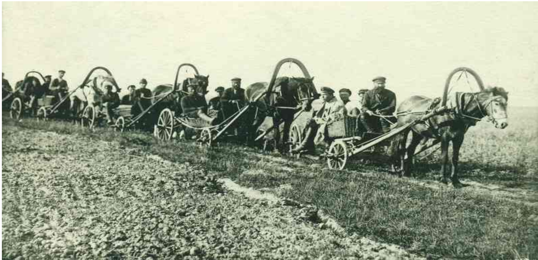
Землеустроительная комиссия оценивает землю

После образования СССР (1922 г.) землеустройство в деревне регулировалось на основе союзного законодательства. Важнейшим нормативно-правовым документом являлись Общие начала землепользования и землеустройства (1928 г.). Все землеустроительные работы проводились по инициативе и за счет государства.