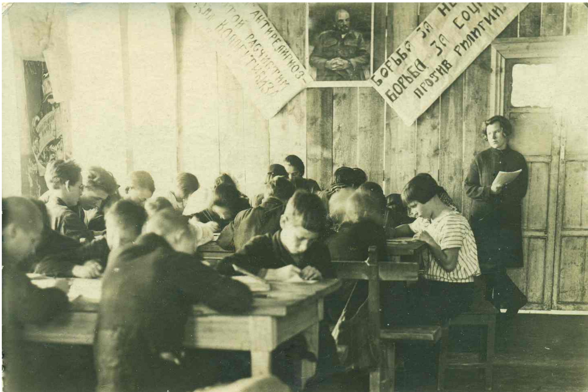
«Школа крестьянской молодежи при коммуне». Открыта в 1928 г.