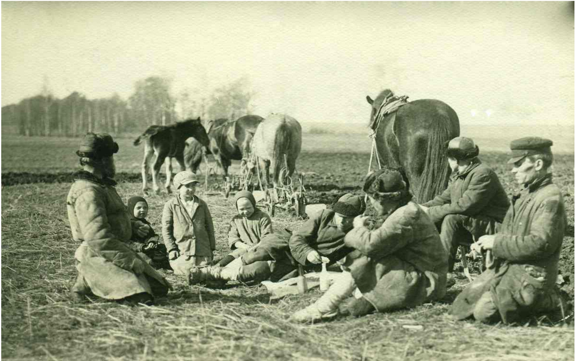
Бригада пахарей на отдыхе