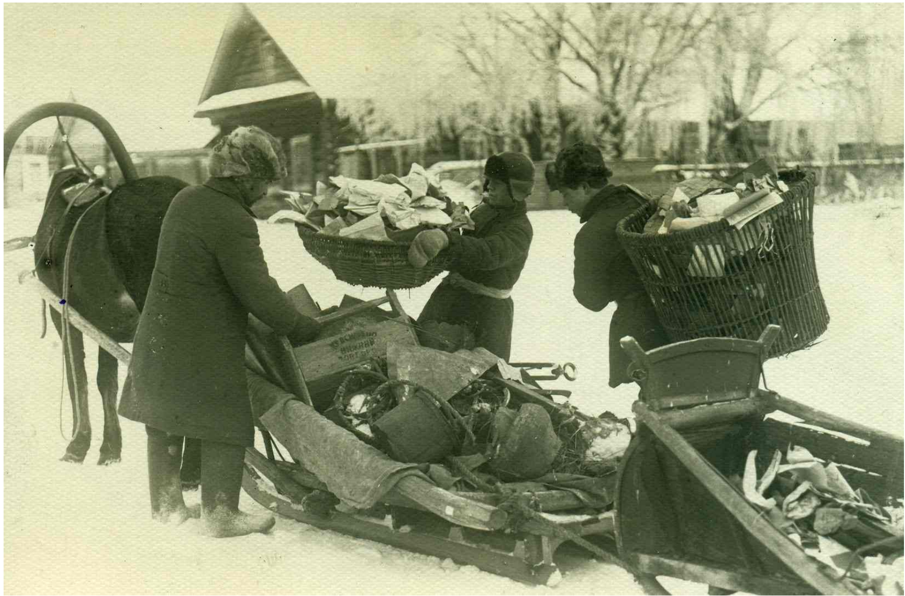
«Вновь вступившие члены районной коммуны собирают утильсырье в задаток на тракторы». 1930 г.