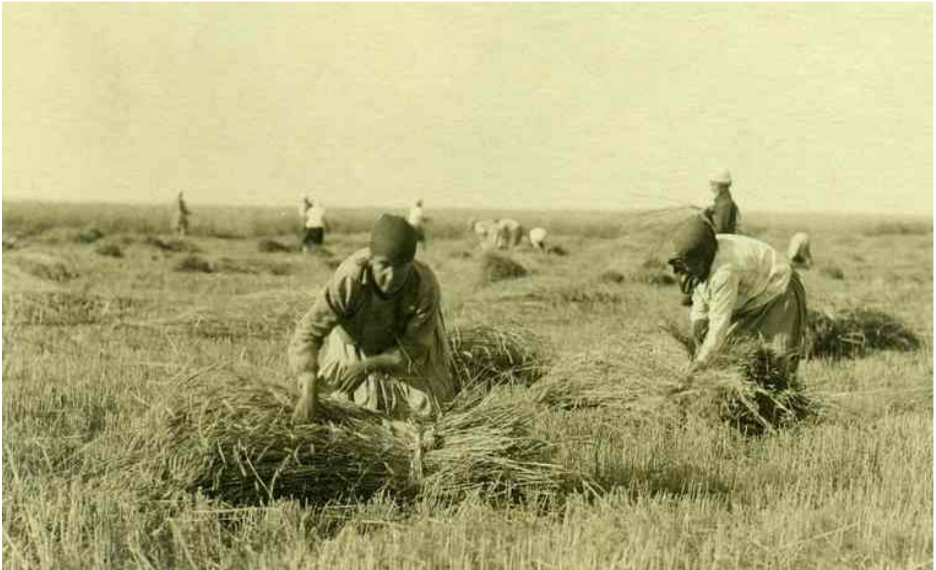
«Жатва. Вязка снопов»