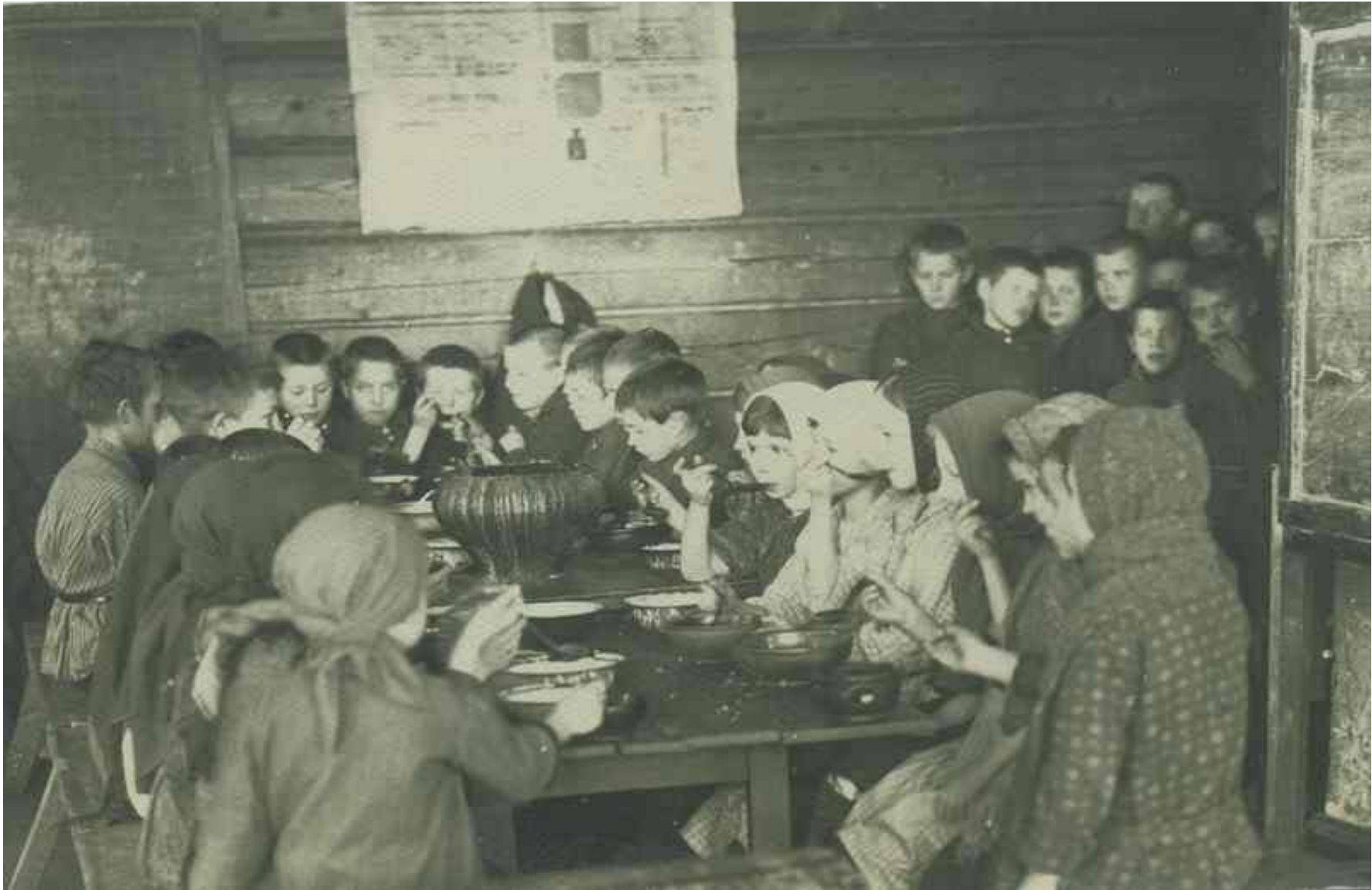
Завтрак в школе