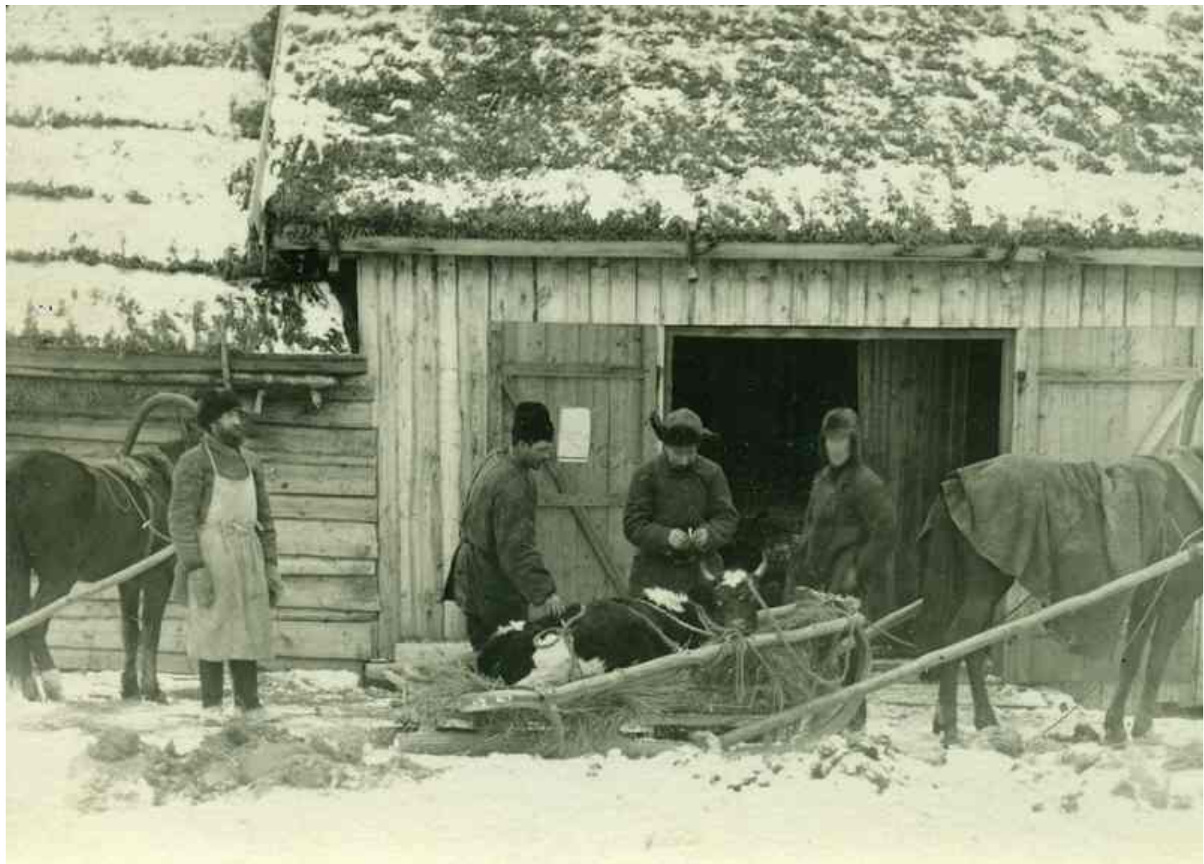
Заготовка мяса для государства