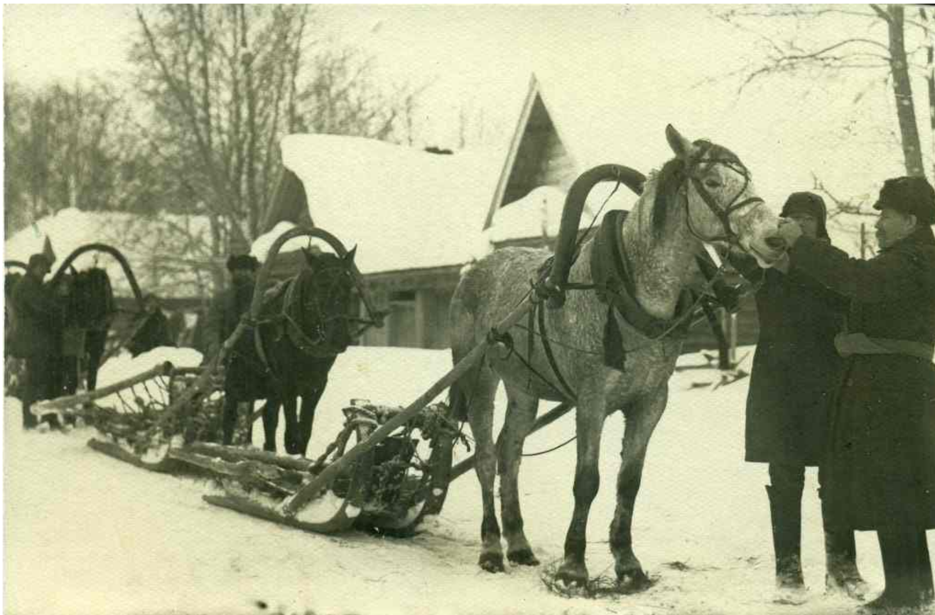
«Ветеринар осматривает лошадей у вновь принятых в районную коммуну»