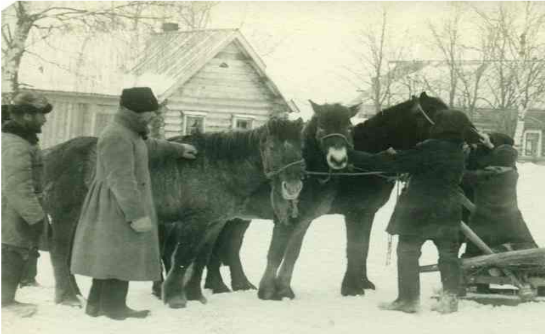
«Лошади, полученные в ссуду от государства» 1930 г.