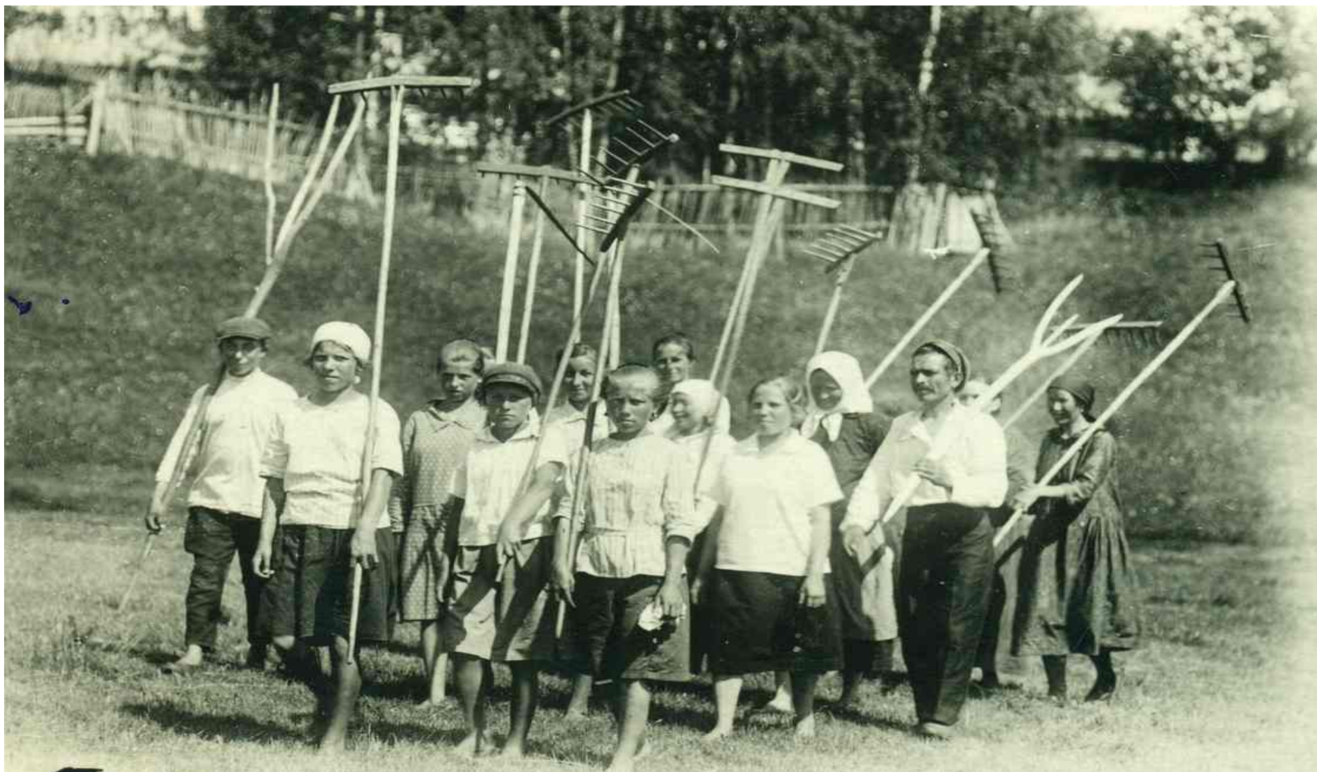
Коммунары возвращаются с сенокоса