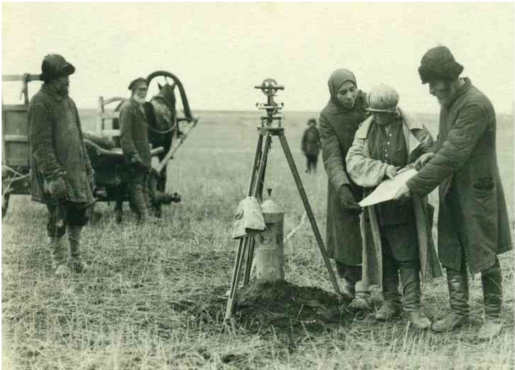
«Землемер определяет границы по плану»