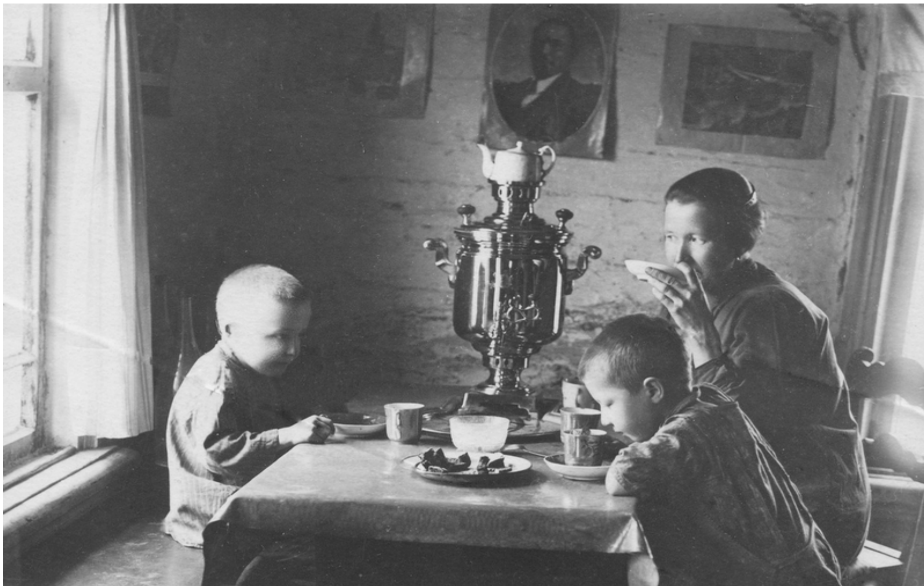
«Отживающий индивидуальный чай колхозника»