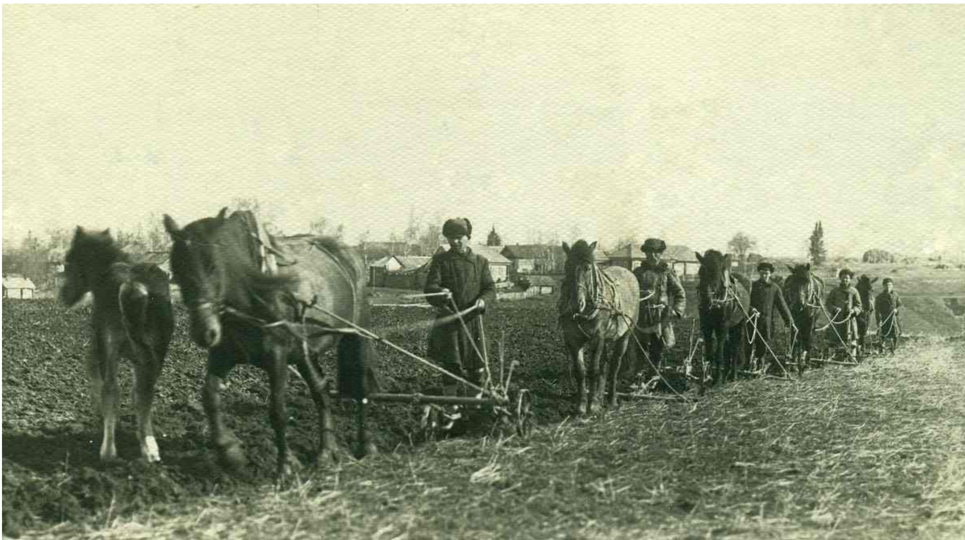
Коллективная вспашка «Бригада пахарей»