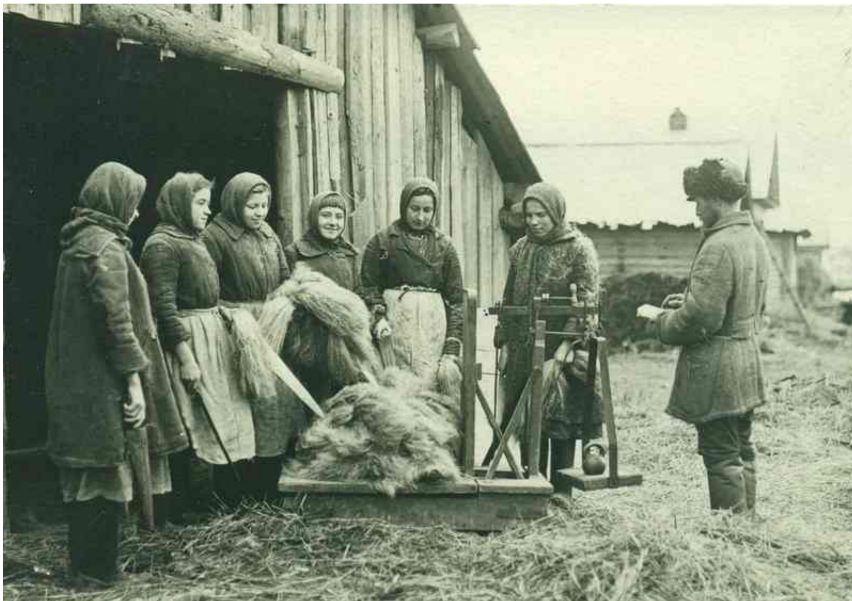
«Развеска льна для членов коммуны»