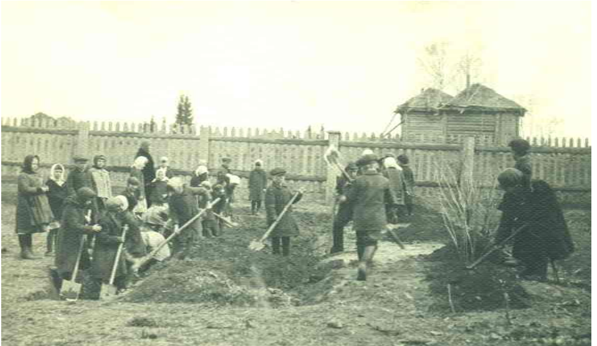
«Школьники высаживают ягодные кусты»