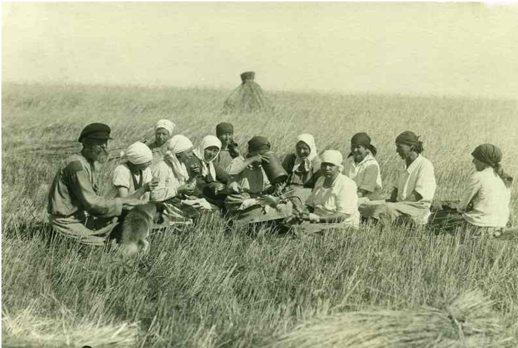
«Жатва. Обед в поле»