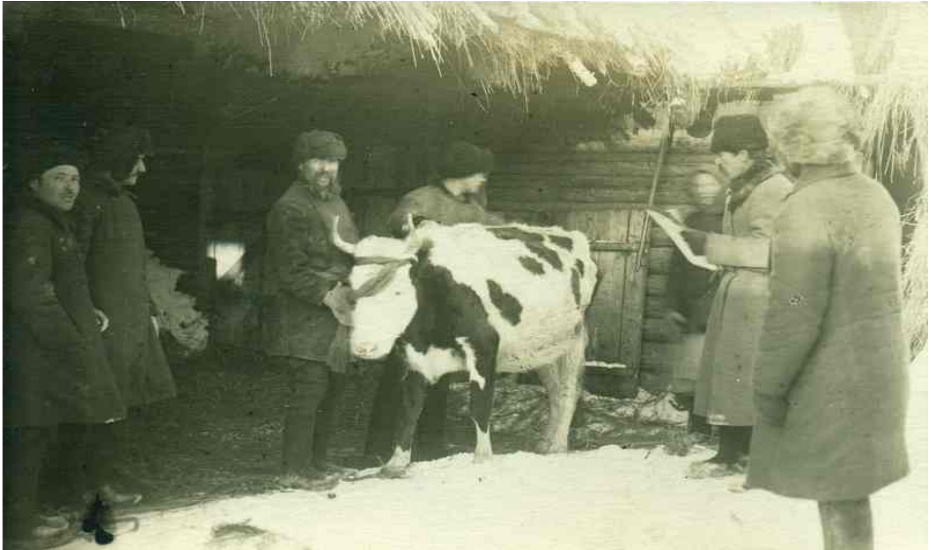
«Комиссия принимает корову в районную коммуну»