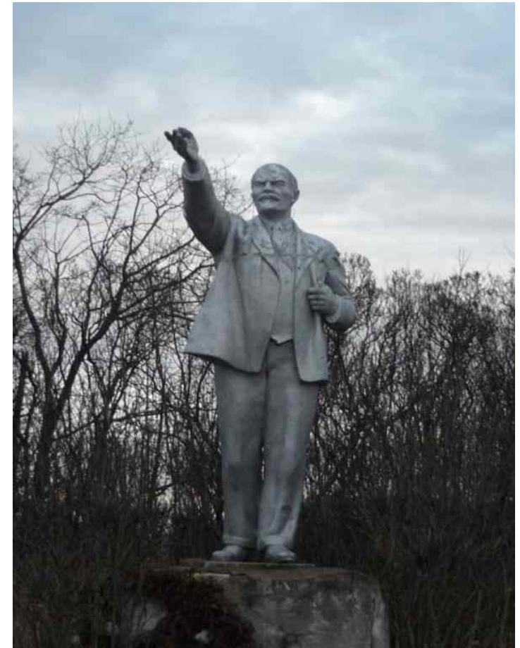
Памятник В.И. Ленину с. Обухово. Установлен в 1934 г.

В июне 1950 года было созвано общее собрание сельхозартелей Обуховского сельсовета. Собрание проходило на площади села Обухово (Липово) у памятника В.И. Ленину. Все члены сельхозартелей единогласно решили объединиться в один колхоз под названием «Ленинец».