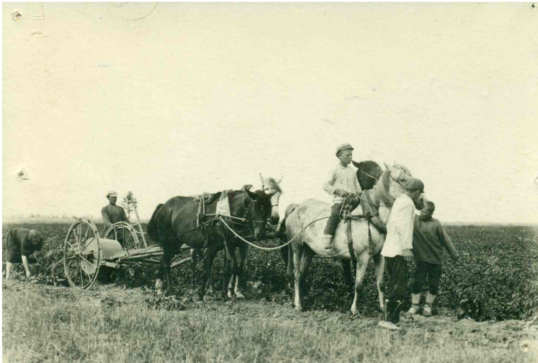
Картофелекопалка 1930 г.