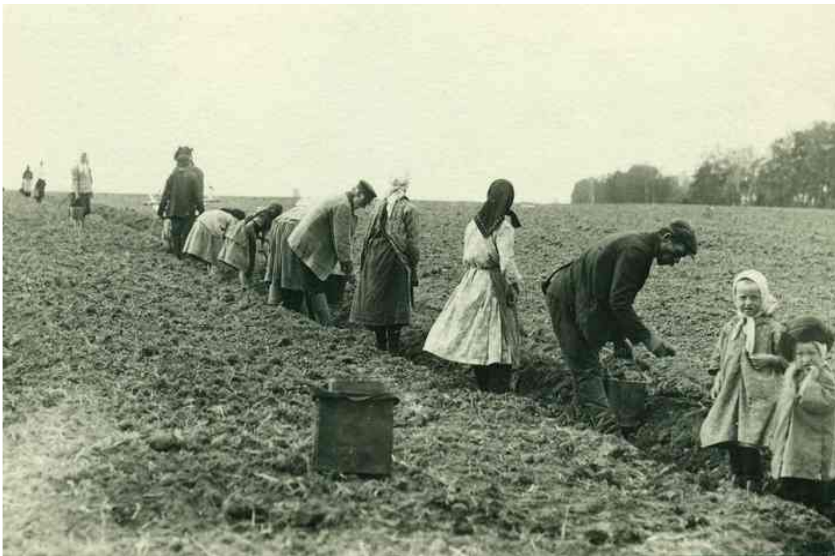
Посадка картофеля 1930 г.