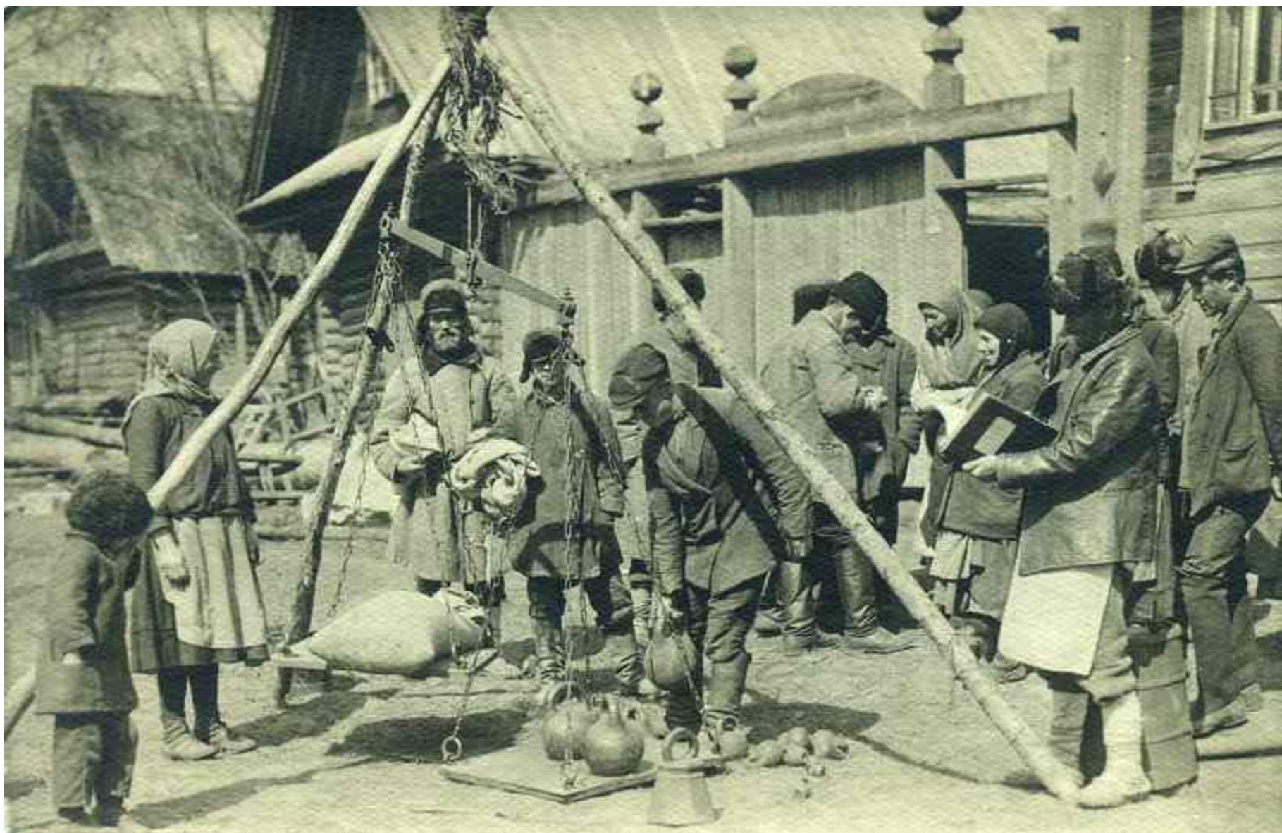
«Выдача коммунарам семян из семенного фонда»