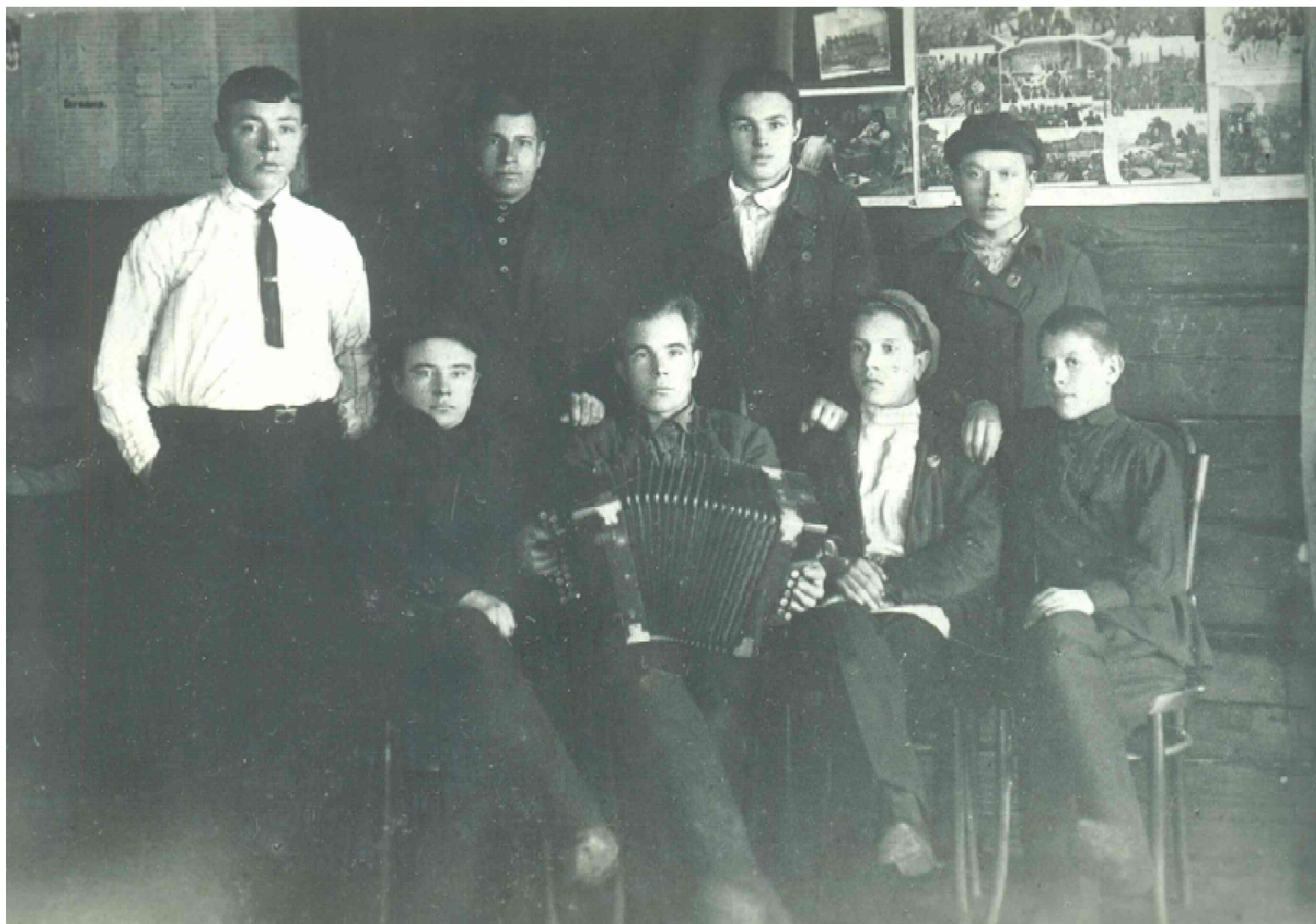
Молодые коммунары с. Липово (Обухово), Обуховская коммуна, 1920-е гг.